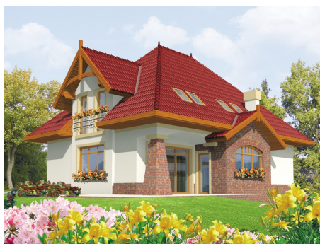
AC Adela - odbicie lustrzane