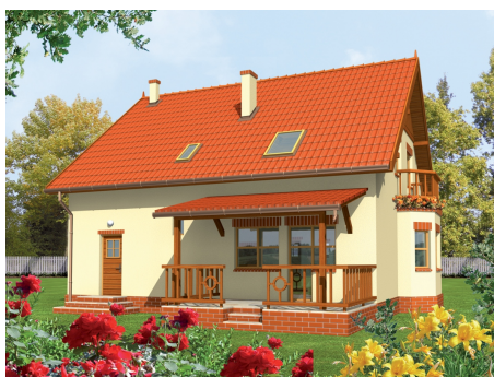
AC Aga - odbicie lustrzane