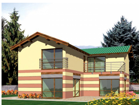
AC Alicja II - odbicie lustrzane