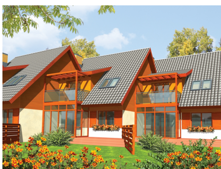
AC Alma - odbicie lustrzane