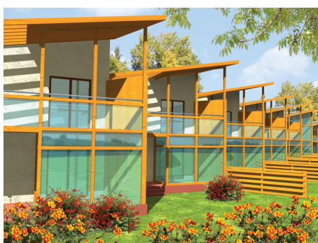
AC Amadeusz - odbicie lustrzane