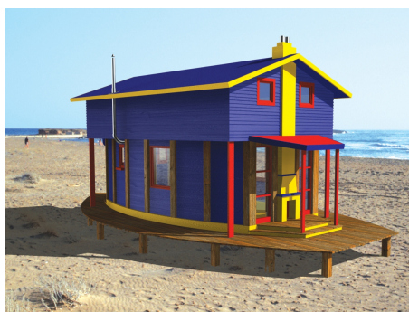
AC Anna - odbicie lustrzane