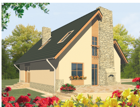
AC Basia - odbicie lustrzane