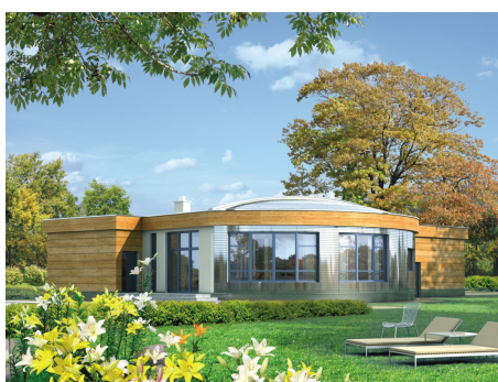
AC Bonifacy II - odbicie lustrzane