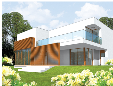
AC Karol - odbicie lustrzane