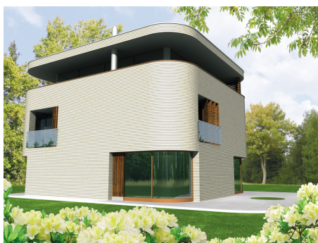
AC Konrad - odbicie lustrzane