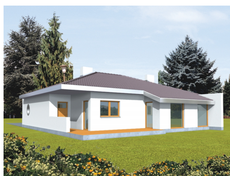
AC Lolita - odbicie lustrzane