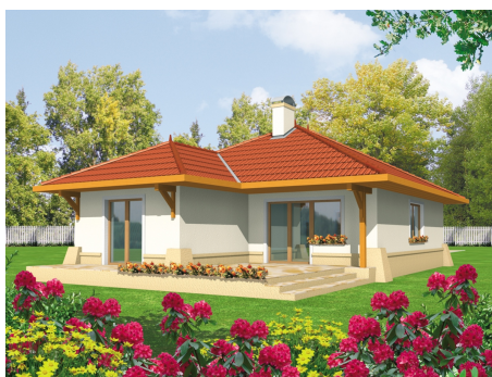
AC Lora - odbicie lustrzane