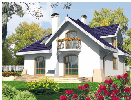
AC Salma - odbicie lustrzane