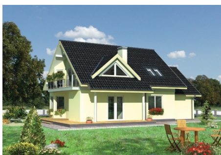
AN MAJA - odbicie lustrzane