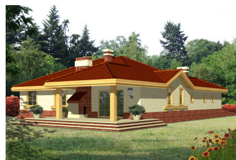
AR Bocian z garażem - odbicie lustrzane