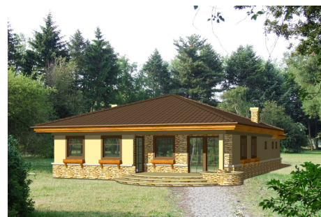
AR Eryk z garażem - odbicie lustrzane