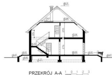
PRZEKRÓJ A-A 1 0 1 3