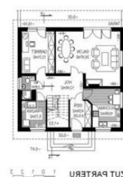
RZUT PARTERU 1 0 1 3