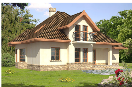
DOM GC1-38 (FA Tryton) - odbicie lustrzane